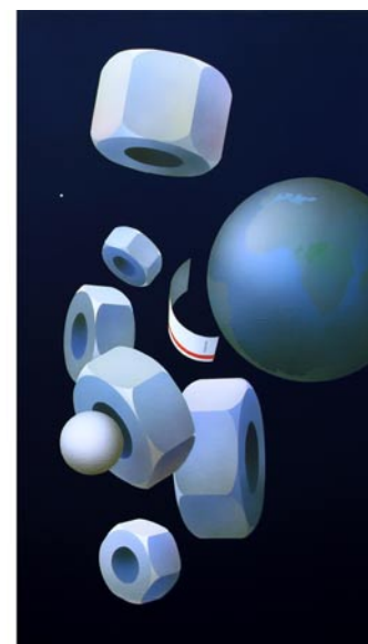
Björn Carlén: ”Rester från Mir (Stereo)”, akryl 120 x 65 + 120 x 65 cm